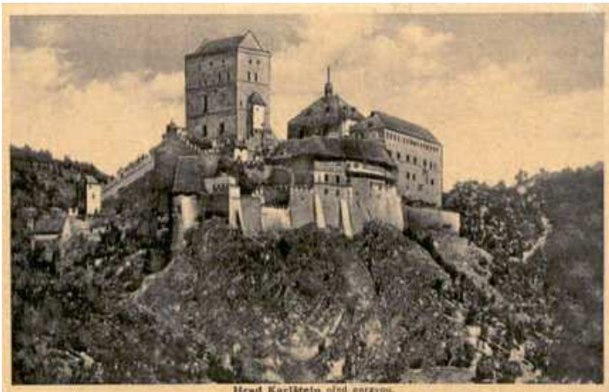
Hrad Karlštejn před opravou.

měsíci máji léta 1422 přišel do Čech ujmout se vlády Zikmund